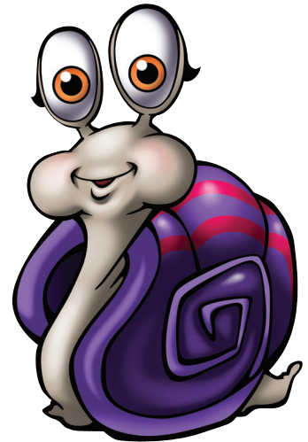
VISTOSA LA CARACOL